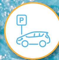
Parqueo exclusivo para visitas