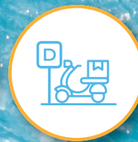
Acceso exclusivo para delivery