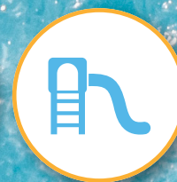
Juegos infantiles x5