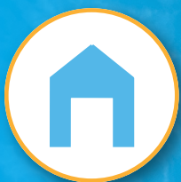
Casa Club x3