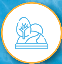
Senderos y parques internos