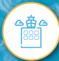
Sky Deck x6