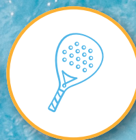
Cancha de Pádel