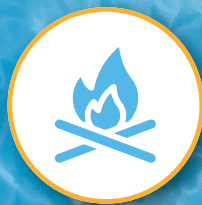
Fire pits x3